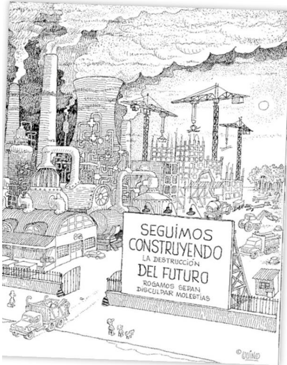
Caricatura de QUINO.