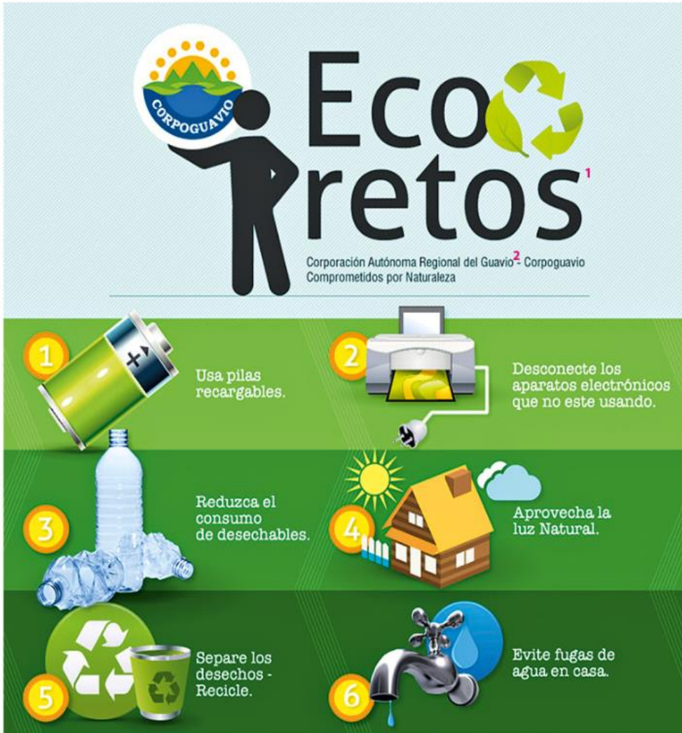
6 Consejos que puedes aplicar para proteger el medio ambiente, Corpoguavio, 2015.

1. reto: défi - 2. Guavio: provincia del centro de Colombia